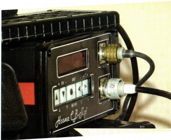
Приемопередатчик «Нозма СВ-Пр1». Передняя панель.