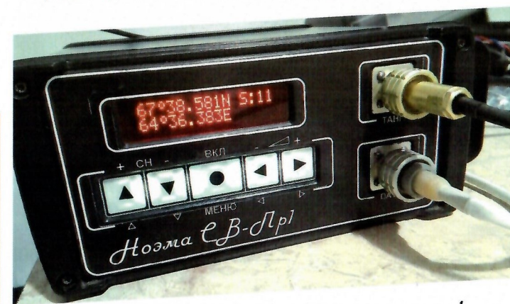
Радиостанция в режиме вывода текущих координат

Выполненные расчеты дальности радиосвязи в средневолновом диапазоне частот (на частоте 500 кГц) показали возможность обеспечения гарантированной передачи навигационных данных на расстояние до 700 км. Корректность проведенных теоретических расчетов была подтверждена проведенными испытаниями на реальной радиотрассе в Омской области вдоль автотрасс Омск–Исилькуль, Омск–Тюмень. Дальность реальной радиотрассы с использованием укороченных резонансных приемопередающих антенн составила свыше 350 км.