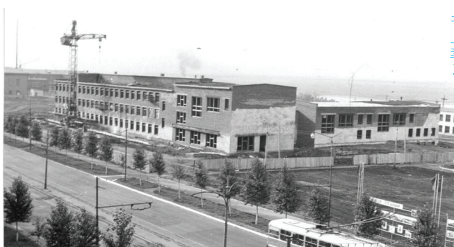
Стройка корпусов (сверху вниз): 8-го, 6-го и главного