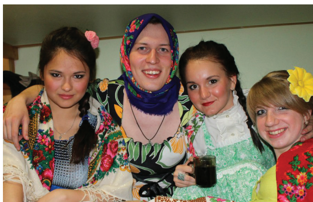
Тематический выезд выходного дня на базу отдыха

Чего только нет в нашем вузе для того, чтобы сделать жизнь студентов еще более красочной! ОмГТУ предоставляет для этого массу возможностей: абонементы в бассейн, билеты в театр и на хоккейные матчи, не говоря уже о выездах на базы отдыха Омской области.