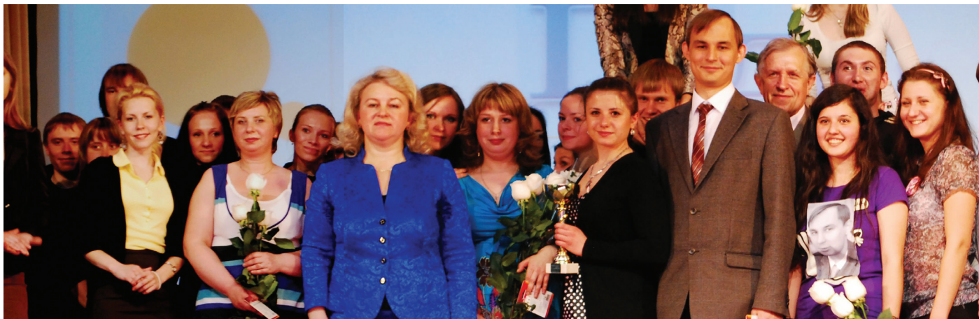
Конкурс «Куратор года - 2012»

Староста – это студент твоей группы и одновременно ее руководитель. С одной стороны он помогает преподавателям и руководству, а с другой – берет на себя груз забот об одноклассниках и продвигает их интересы перед администрацией. Именно староста обязан сообщать все важные новости. Именно он контролирует соблюдение правил внутреннего распорядка. Так что дело это непростое и ответственное.