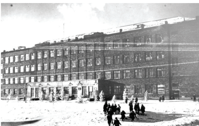
ул. Долгирева, 60

История основания Омского государственного технического университета восходит к 1942 г.