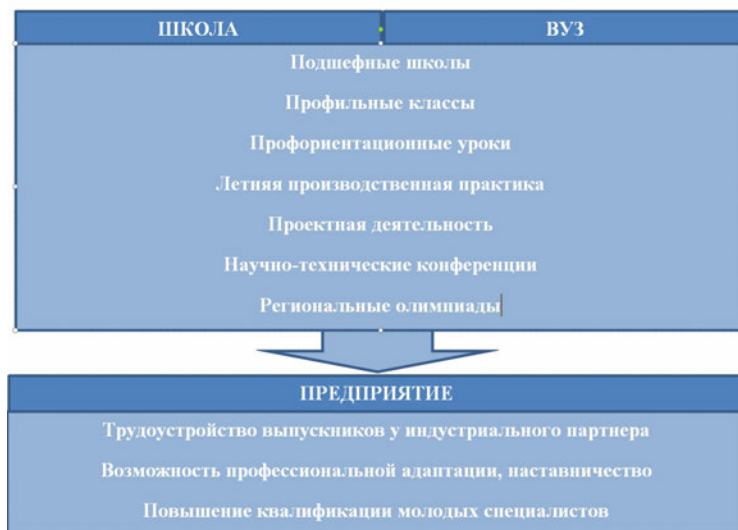
Рис. 2. Схема взаимодействия «школа-вуз-предприятие»

подготовке специалистов и научно-технического взаимодействия для каждого предприятия будет разной: от широко применяемых договоров о совместной реализации образовательных программ до создания совместных производств с реализацией образовательного процесса. Такое сотрудничество также позволит решить целый ряд таких задач, как сопровождение профессионального самоопределения обучающихся, оказание помощи школьным педагогам в раннем выявлении, поддержке организации образовательного сопровождения талантливых детей, привлечение обучающихся к выполнению научно-исследовательских проектных работ, популяризация физики и других предметов естественно-научного профиля и вовлечение детей в образовательное и культурное пространство университета.