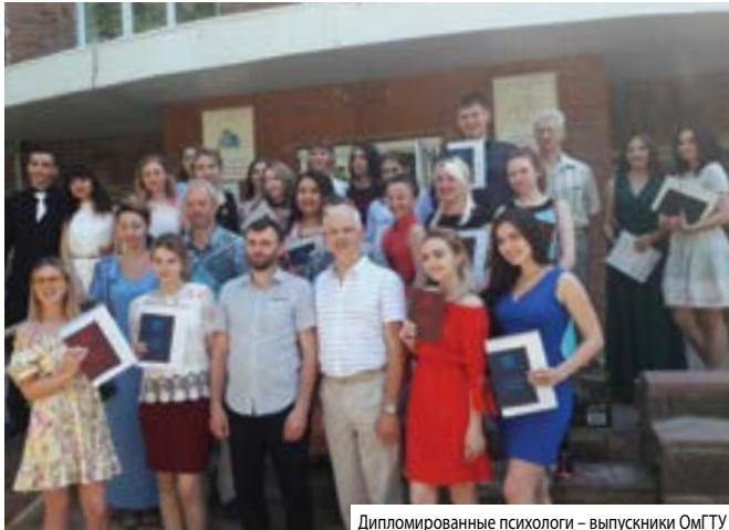
Дипломированные психологи – выпускники ОмГТУ

Есть два важных отличия. Психолог может быть психотерапевтом, но не врачом. А есть врач-психотерапевт. Это медицинский работник, который может осуществлять как медикаментозное вмешательство, так и психологическое. Врач лечит, а психолог нет. В случае с последним используется