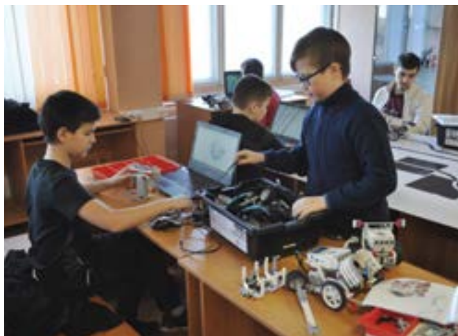
Ребята под руководством ученых ОмГТУ создают собственные проекты в области информационных технологий, робототехники и дизайна. От идеи до готового результата проходят весь цикл: техническое предложение, эскизный проект, рабочая документация, модель и рабочий образец. Созданный продукт ребята успешно презентуют

– Вузы на свое усмотрение имеют право до 10 баллов начислять абитуриентам. У нас