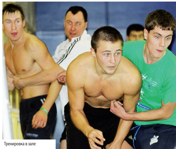
Тренировка в зале