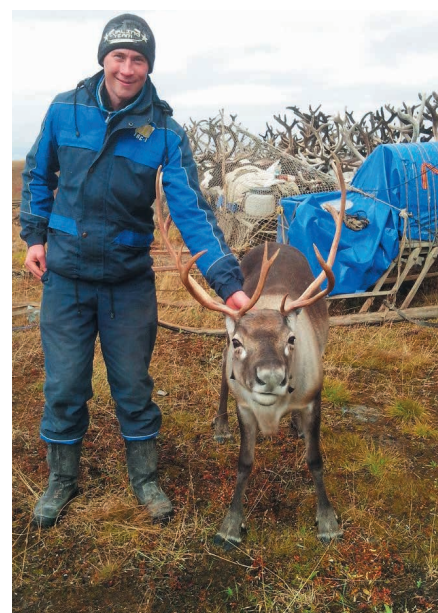
Из фотоальбома ССО «Феникс»