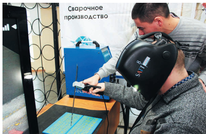
Во время IX студенческой научно-практической конференции «Приборостроение и информационные технологии», посвященной дню образования АО «ОНИИП»

Сегодня одна из ключевых проблем развития высшего образования в нашей стране – приведение образовательных стандартов в соответствие с профессиональными. На АО «ОНИИП», АО «ОмПО «Иртыш» и АО «ОПЗ им. Козицкого» заинтересованы в решении данной проблемы: работа со студентами, их активное вовлечение в научно-техническую деятельность и производственный процесс – одно из приоритетных направлений для предприятий. Ведь за молодыми будущее высоких технологий.