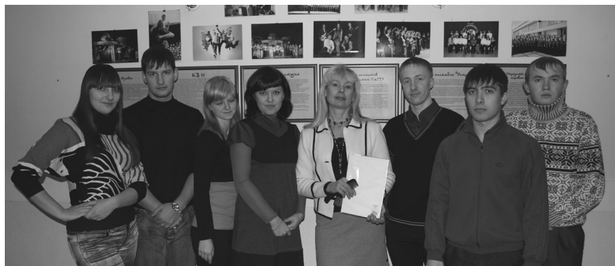
Объединенный студенческий совет общежитий

В связи с 65-летием Великой Победы, студенческие советы 1 раз в месяц проводили интересные мероприятия по гражданско-патриотическому и духовно-нравственному воспитанию студентов.