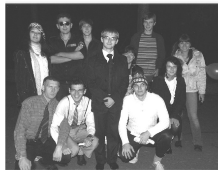
Совет студенческого самоуправления

- пропаганда трезвого и здорового образа жизни.