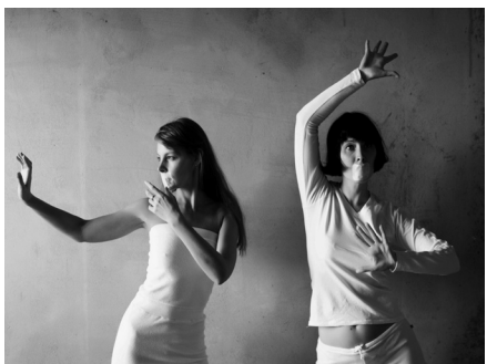
О. Савченко «Песня без слов»