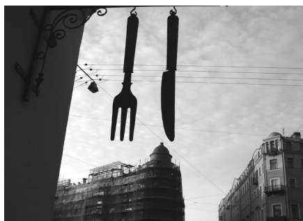
А. Ваняшов «Это не сон»