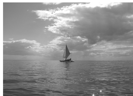
М. Мызников «Алые паруса»