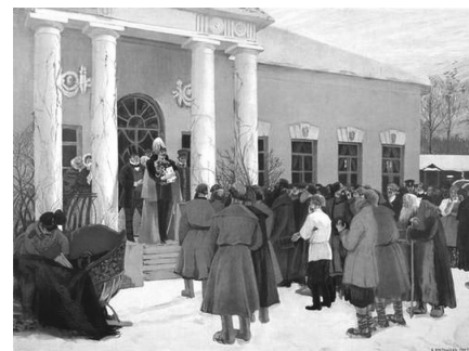
Б. Кустодиев. Чтение Манифеста

Да, благодаря реформе крестьяне получили право на местное самоуправление. Появились такие демократические институты, как сельский сход и волостной сход, в который входило несколько сельских. На них избирали сельского и волостного старшину, которые следили за исполнением повинностей, штрафовали за правонарушения, принуждали к общественным работам и т.д. Однако в действительности местное самоуправление никакой самостоятельности не имело. Все вышеперечисленные структуры контролировались мировыми посредниками, среди коих большинство