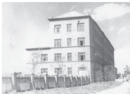
ул. Долгирева, 60